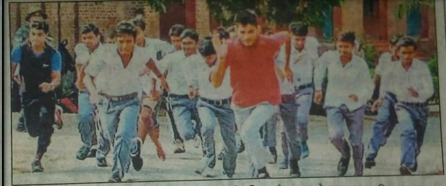
डीईआई में गुरुवार को एनसीसी में भाग लेने के लिए दौड़ लगाते छात्र।